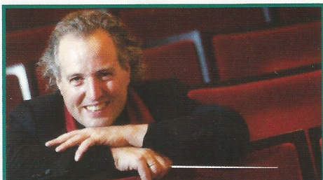
Sarà il direttore d'orchestra austriaco Manfred Honeck , 57 anni, a inaugurare i concerti promossi da "Santa Cecilia" per il Giubileo straordinario